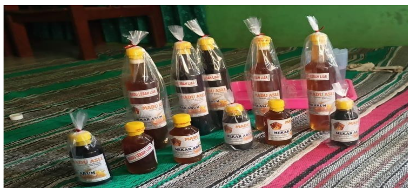
Gambar 3. Produk Siap untuk di Pasarkan