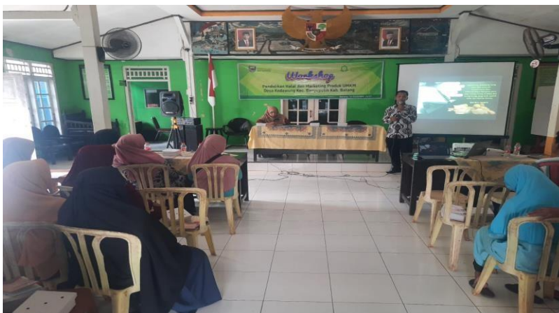
Gambar 6. Workshop Branding, Packaging, dan Marketing Produk

Pada dua sesi kegiatan pertama ini diikuti oleh pelaku UKM sebanyak 25 orang secara antusias. Dalam sesi pertama ini disepakati dengan para pelaku UKM sektor pangan pada tahap tindak lanjut dengan pendampingan pengemasan produk makanan yang mereka kelola mulai dari branding, packaging hingga marketing melalui online khususnya bagi produk seperti madu.