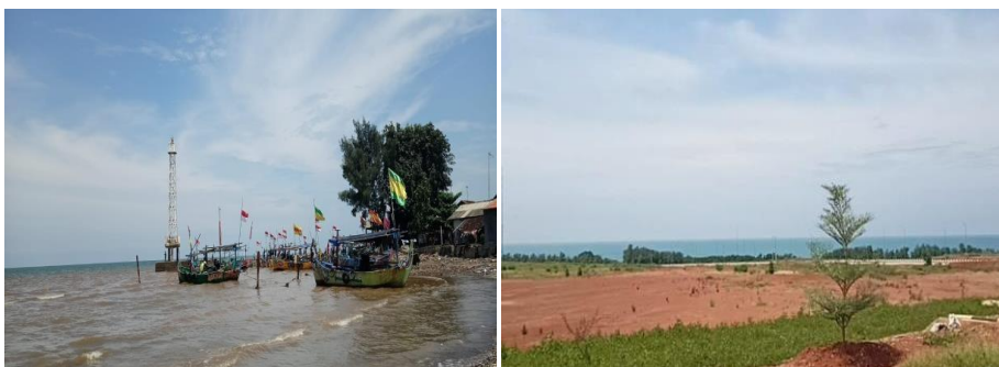
Gambar 1. Penelusuran Wilayah

Transect merupakan kegiatan lanjutan yang dilakukan dalam perencanaan setelah melakukan pemetaan. Transect atau penelusuran desa dilakukan untuk mengecek langsung apayang telah dilakukan sebelumnya. Tujuan dari transect ini untuk melakukan pembuktian terhadap data yang telah di dapat ketika pemetaan sehingga dapat mempertajam potensi yang dimiliki oleh masyarakat dan melihat secara lebih seksama apa yang sekiranya perlu di lakukan sebagai bentuk pemberdayaan masyarakat. Dengan kata lain bahwa terkini ini dapat mempertajam masalah apa yang dihadapi oleh masyarakat.