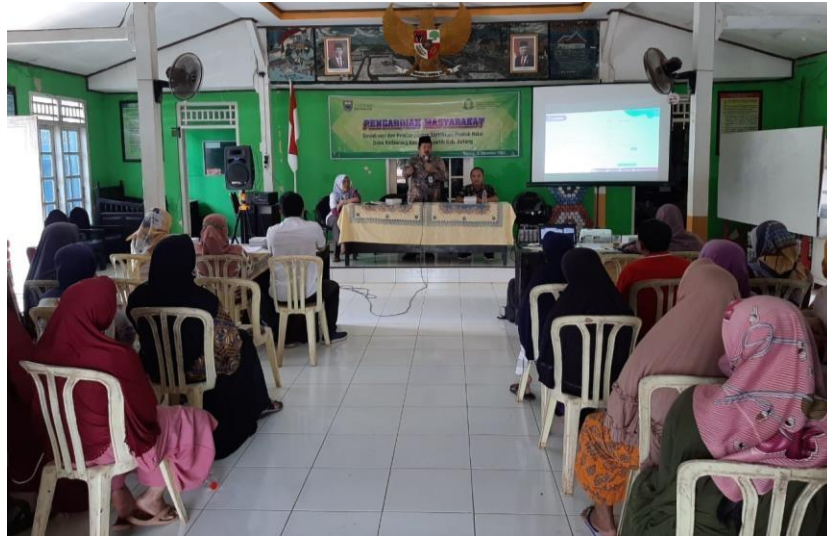
Gambar 7. Sosialisasi Sertifikasi Halal