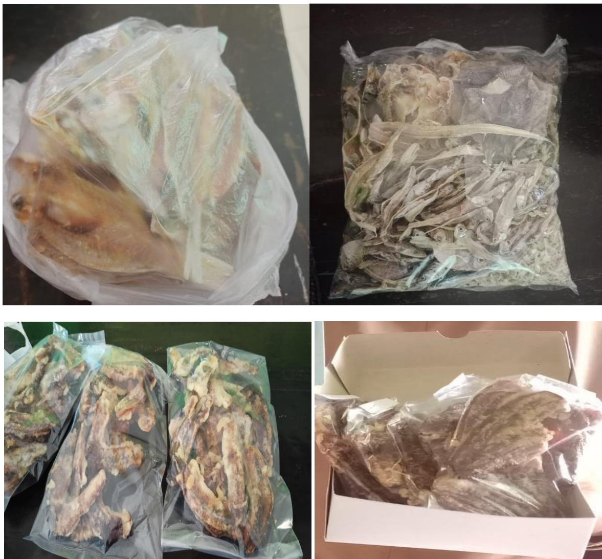
Gambar 2. Produk UKM Sebelum dan Sesudah Pendampingan